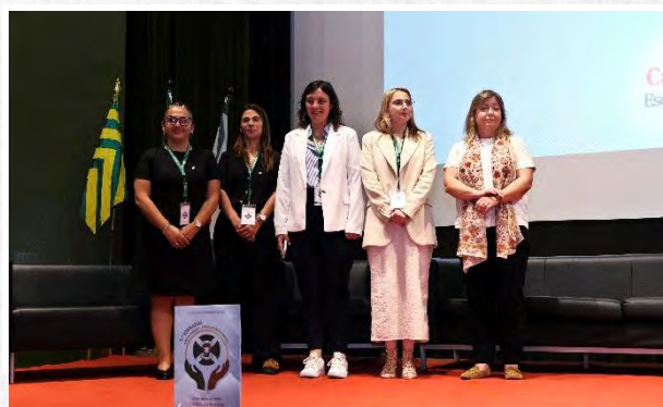
Técnicas dos CAMPS agraciadas