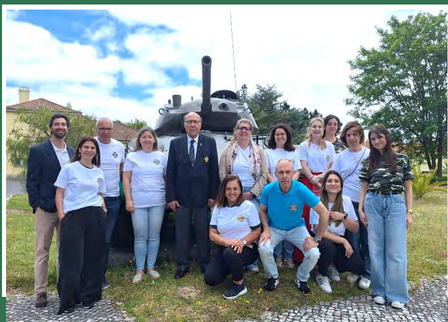
Fotografia de grupo dos Técnicos dos CAMPS na Escola de Sargentos do Exército