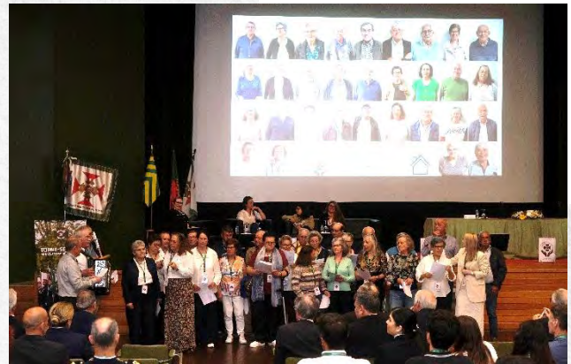
Atuação musical do grupo do projeto «ComViver»