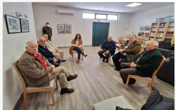
Grupo de Combatentes

A terapia de grupo pretende oferecer um espaço único de intervenção, em particular para pessoas que enfrentam traumas profundos, como os Combatentes da Guerra do Ultramar. Este espaço de encontro facilita o processo de autoexploração e integração emocional, promovendo uma recuperação significativa e duradoura. Para os Combatentes, o grupo pode ser um lugar de reconciliação consigo mesmos e com as suas histórias, ajudando-os a encontrar um novo sentido e propósito na vida.