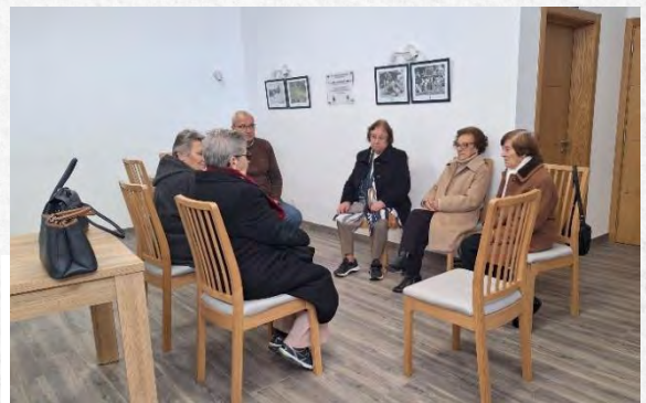
Grupo de Mulheres de Combatentes