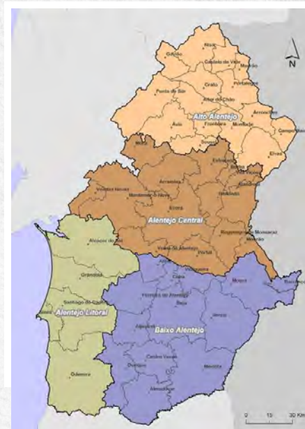
Área de atuação das Visitas de Apoio Domiciliário da Liga dos Combatentes no Alentejo

Através dos CAMPS e, em particular do Serviço Social, é possível devolver maior dignidade a quem serviu Portugal na Guerra, com o sacrifício da própria vida e com sofrimento familiar. Neste sentido, foram tomadas ações para criar e promover um ambiente de segurança, no qual os Combatentes podem manifestar desejos, medos e necessidades. As Visitas de Apoio Domiciliário integram-se num serviço humanizado e individualizado, promovendo o bem-estar físico, emocional e social dos Combatentes e das suas famílias, no conforto das suas casas.