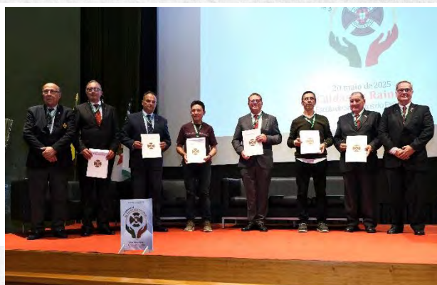
Diplomas de Reconhecimento entregues aos Delegados Sociais