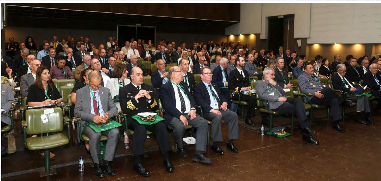
Aspeto da assistência

No dia 20 de maio de 2025, decorreram as 5. as Jornadas de Apoio Médico, Psicológico e Social da Liga dos Combatentes (LC), na Escola de Sargentos do Exército (Caldas da Rainha), que contaram com presença de quase 200 participantes entre entidades convidadas, dezenas de Núcleos e Sócios da LC, especialistas nas áreas da saúde e apoio social e representantes de diversas entidades do universo da Defesa Nacional e militar que atuam nas áreas da medicina, psicologia e serviço social.